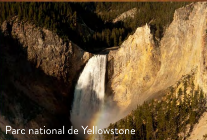
Parc national de Yellowstone