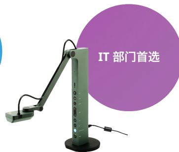
VZ-R HDMI/USB 双模式实物摄影机