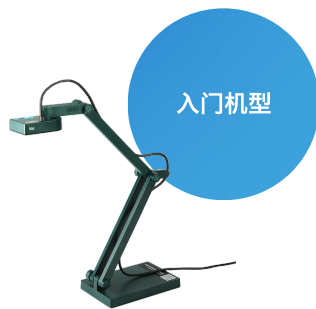
V4K 超高画质 USB 实物摄影机