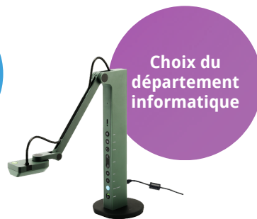
Visualiseur VZ-R HDMI/USB mode mixte 8MP