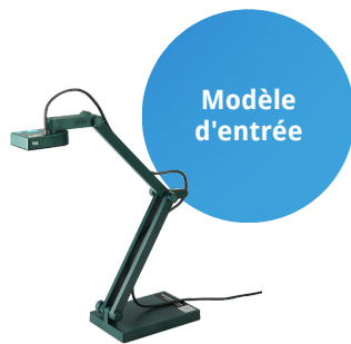
Visualiseur V4K ultra haute définition USB

Trouvez le meilleur visualiseur IPEVO pour vous