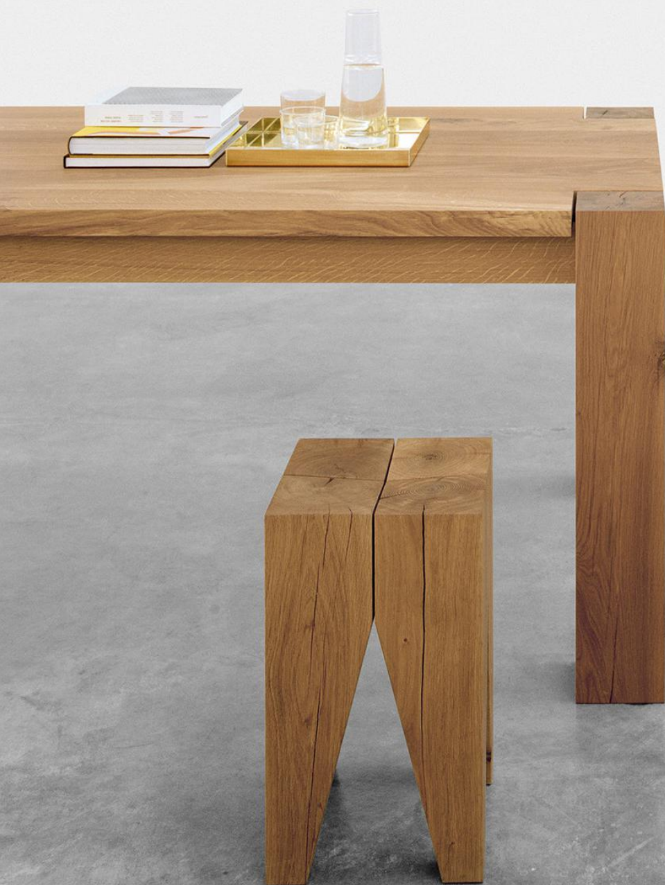
CM04 ITO TABLETT / TRAY MESSING, POLIERT / BRASS, POLISHED TA04 BIGFOOT™ TISCH / TABLE ST04 BACKENZAHN™ HOCKER / STOOL