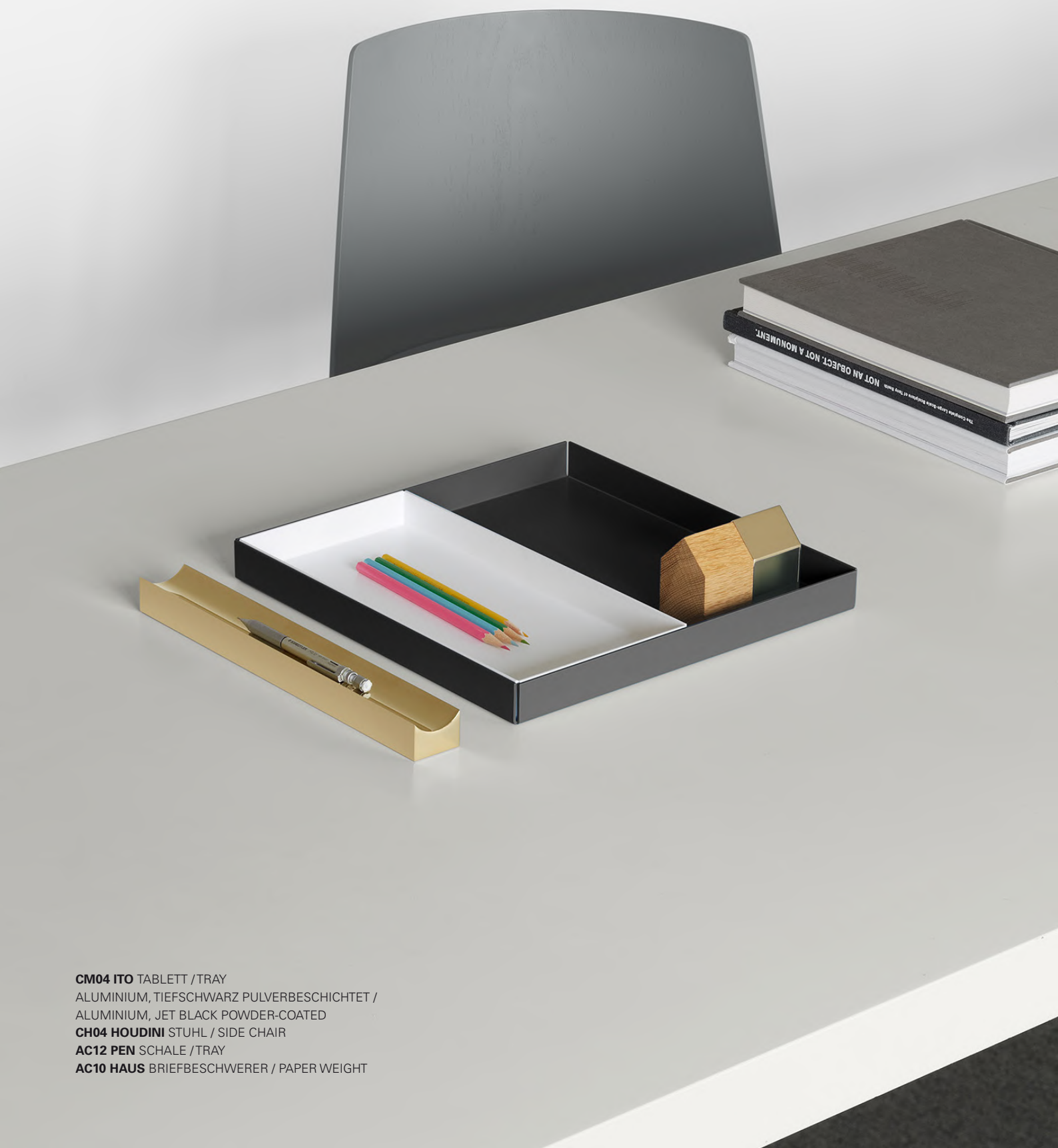
CM04 ITO TABLETT / TRAY ALUMINIUM, TIEFSCHWARZ PULVERBESCHICHTET / ALUMINIUM, JET BLACK POWDER-COATED CH04 HOUDINI STUHL / SIDE CHAIR AC12 PEN SCHALE / TRAY AC10 HAUS BRIEFBESCHWERER / PAPER WEIGHT