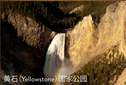
黄石 (Yellowstone) 国家公园