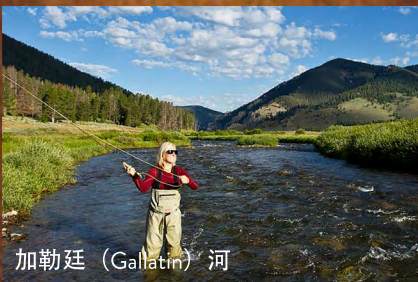
加勒廷 (Gallatin) 河